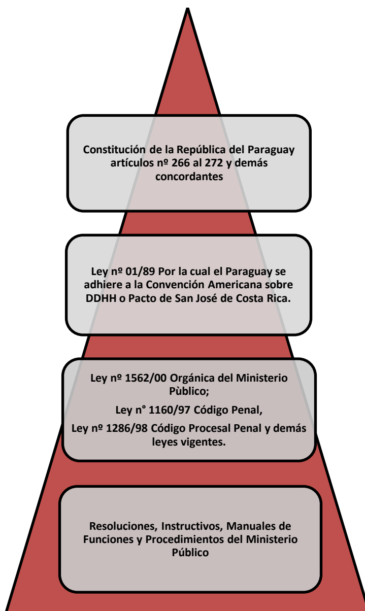
Figura 2. Presentación del marco legal de acuerdo al orden de prelación.